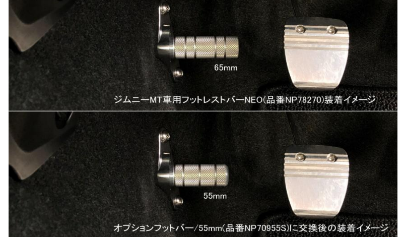
オプションフットバー/55mm装着比較