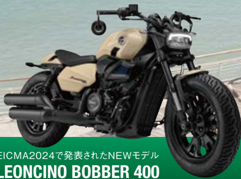
EICMA2024で発表されたNEWモデル LEONCINO BOBBER 400