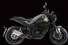
Gray & Black