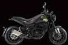
Brown & Black