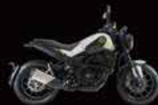
White & Black