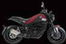
Red & Black