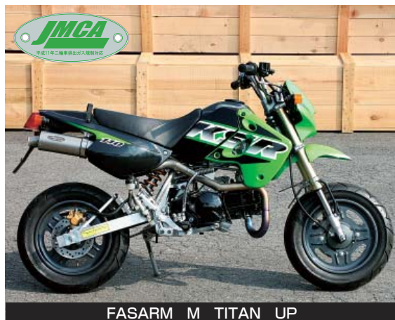
FASARM M TITAN UP