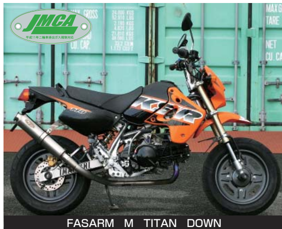
FASARM M TITAN DOWN