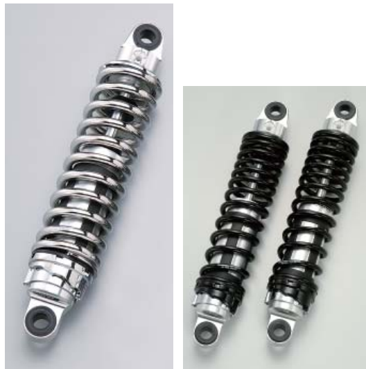
クロームスプリング仕様