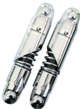
スラッシュカット

412シリーズをベースに、マウントカバー&マウントキャップ、クロームスプリングカバーを装備。シンプル且つシャープな“スラッシュカット”“ダブルカット”、クラシックテイストの“ビンテージ”、迫力の“フレーム”をラインナップ。プログレッシブスプリングと高圧ガスモノチューブによるオイルダンパー、プリロード調整を装備。サイズは11インチと11.5インチ。ローダウンでネオクラシックなカスタムに最適です。