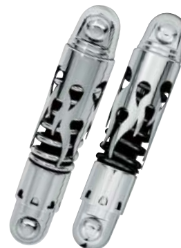
フレームクローム/ブラック