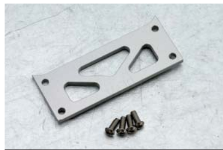
リペアピッチプレートセット