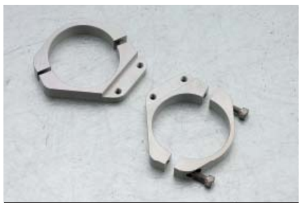
リペアフォークブラケットセット