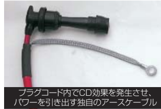
プラグコード内でCD効果を発生させ、パワーを引き出す独自のアースケーブル