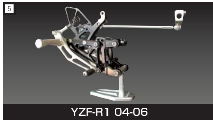
5 YZF-R1 04-06