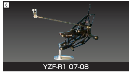
6 YZF-R1 07-08