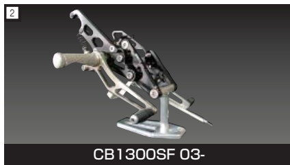
2 CB1300SF 03-