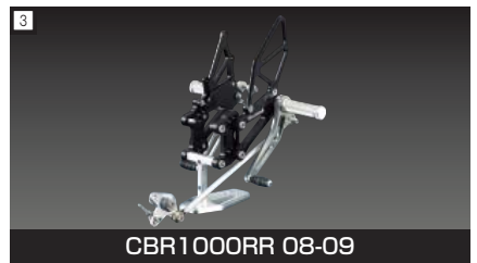
3 CBR1000RR 08-09