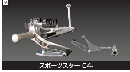
16 スポーツスター 04-