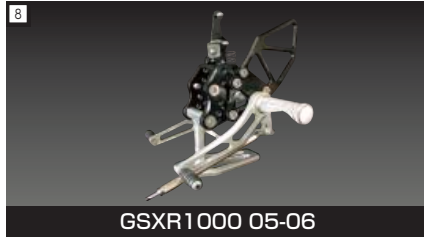
8 GSXR1000 05-06