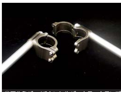
①アルミパー/ゴールドカラークランプ