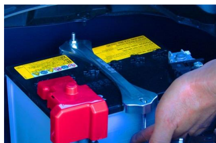
純正バッテリーロッドのままだと、前側のロッドが短いためナットを固定できません。(Dサイズバッテリー搭載車)