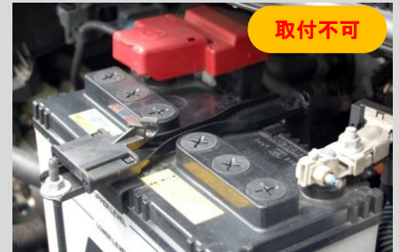
ラジエーターサポートに固定するタイプ