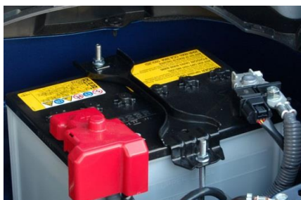
純正の状態。後ろ側のバッテリーロッドは、十分な長さがあるが、前側は短い。(Dサイズバッテリー搭載車)

トヨタ86/スバルBRZの場合、純正バッテリーロッドが短いため、別売のNEOPLOTバッテリーロッド(SUS304)をお買い求めください。