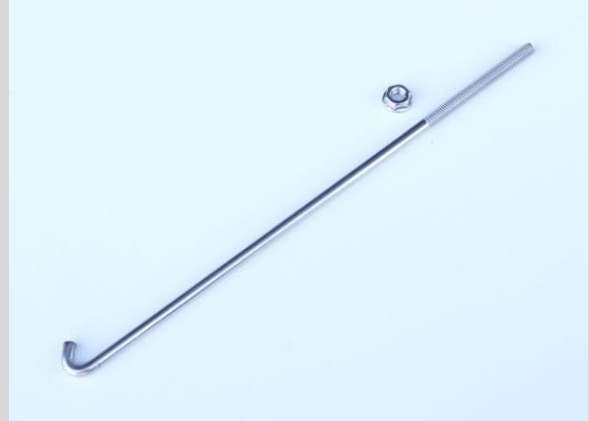
品番 : NP99190 品名 : NEOPLOTバッテリーロッド(SUS304)240mm 材質 : ステンレス製

純正バッテリーの時は取付け出来ていても、社外バッテリーに交換されたときには取付けできなくなる場合がございます。これは、同じ規格のバッテリーであっても、銘柄によりサイズが異なることがあるためです。予めご理解ください。