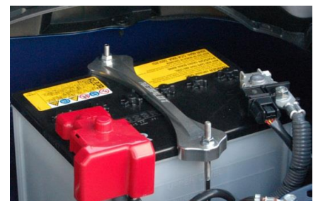
NEOPLOTバッテリーロッド(SUS304)180mmを使用することで取付けることが可能となります。(Dサイズバッテリー搭載車) ※Bサイズバッテリー搭載車の場合は、ロッド長240mmをお選びください。