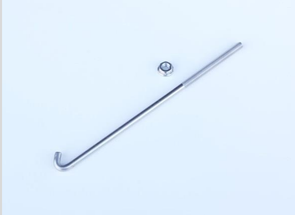
品番 : NP99090 品名 : NEOPLOTバッテリーロッド(SUS304)180mm 材質 : ステンレス製

純正バッテリーロッドの長さがバッテリー上端(上面)より10mm以上突出していることをご確認ください。10mm以下の場合、確実な固定が出来ないためナット分の長さが確保できるバッテリーロッドに交換する必要があります。車種によっては、別売のNEOPLOTバッテリーロッド(SUS304)を使用することでお取付けが可能となります。